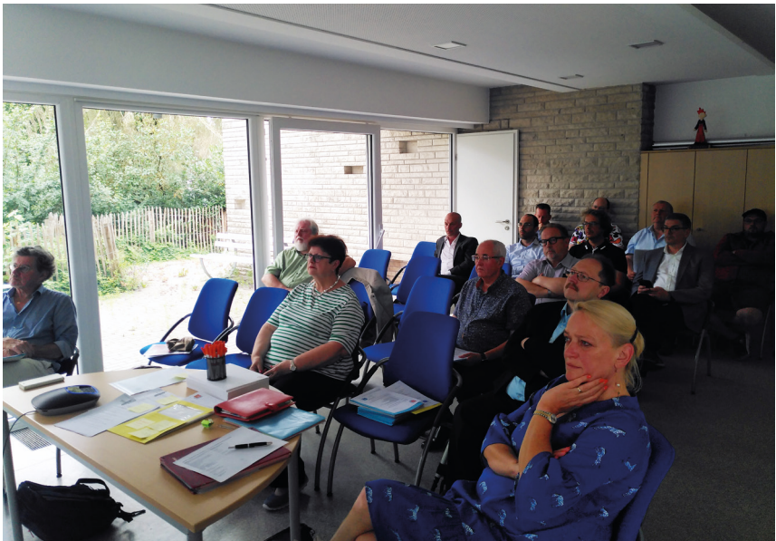
Lors de l'Assemblée Générale du 30 juin 2022, l'Association de Soutien aux Travailleurs Immigrés (ASTI) a rejoint les membres de l'Agence du Bénévolat.